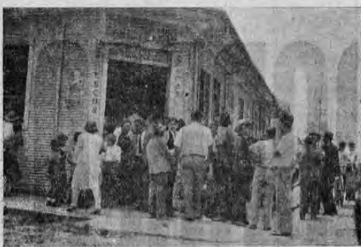
El público aglomerado frente al lugar del suceso